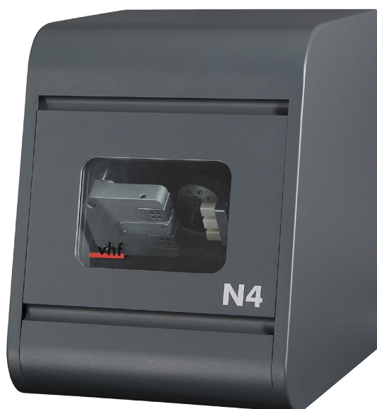
↑ Nassschleifmaschine N4 Impression.