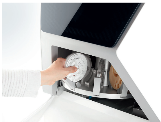
Serraggio a una mano grazie alla DirectDisc Technology